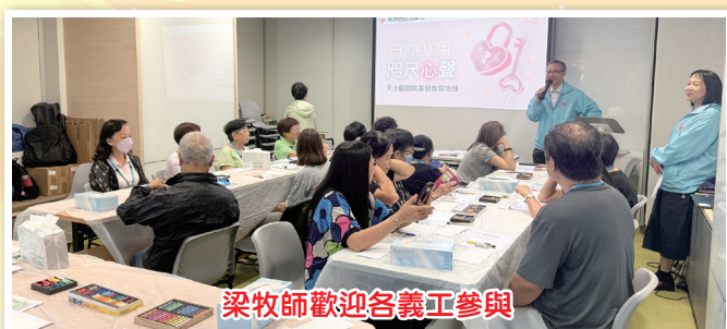
梁牧師歡迎各義工參與