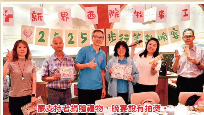
蒙支持者捐贈禮物，晚宴設有抽獎。