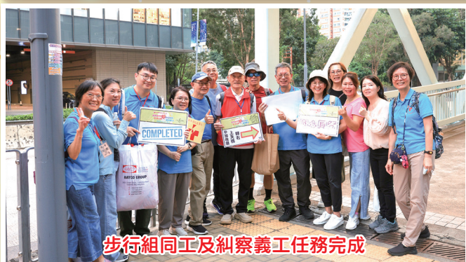
步行組同工及糾察義工任務完成