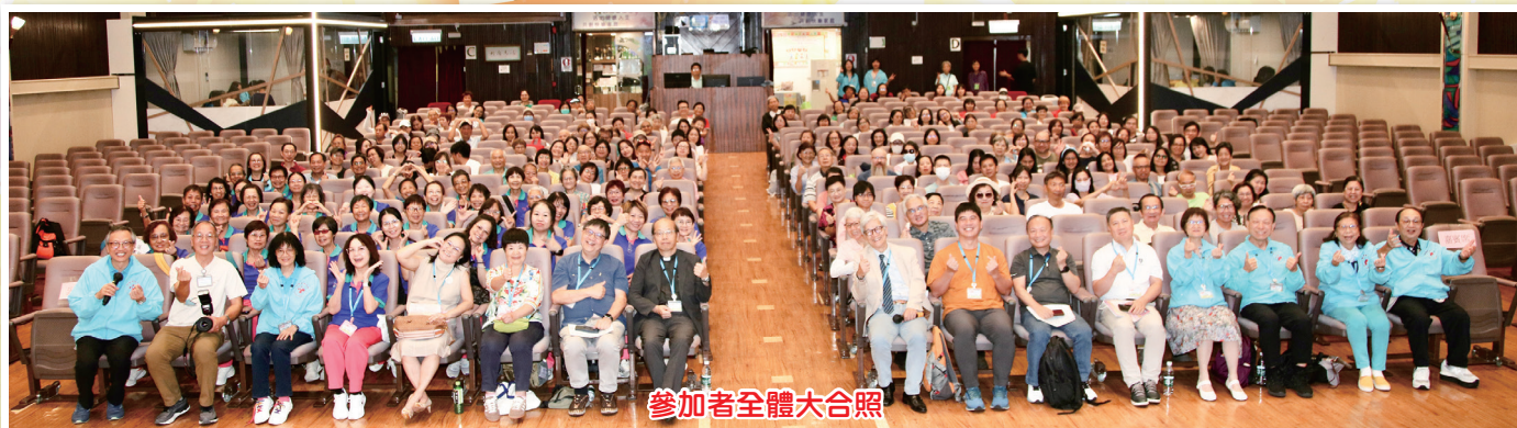
參加者全體大合照