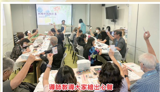
導師教導大家繪出心聲