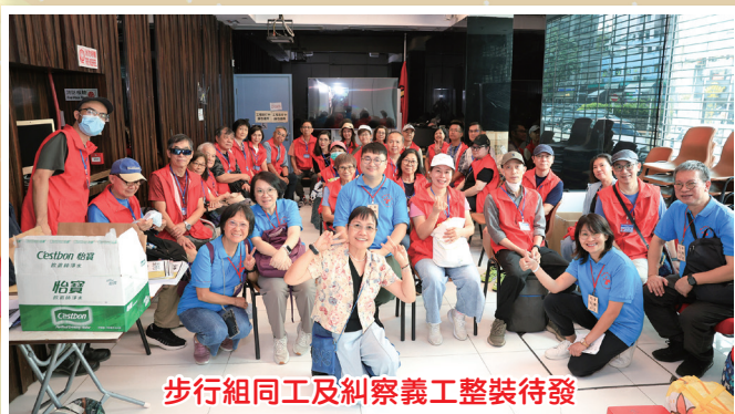
步行組同工及糾察義工整裝待發