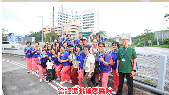
途經遠眺博愛醫院