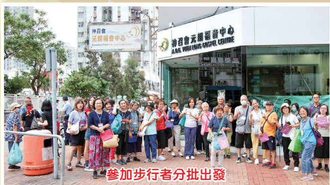
參加步行者分批出發