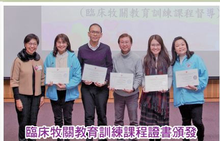
臨床牧關教育訓練課程證書頒發