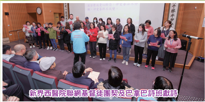
新界西醫院聯網基督徒團契及巴拿巴詩班獻詩