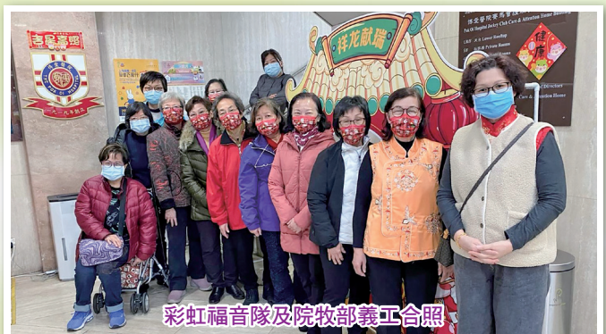
彩虹福音隊及院牧部義工合照