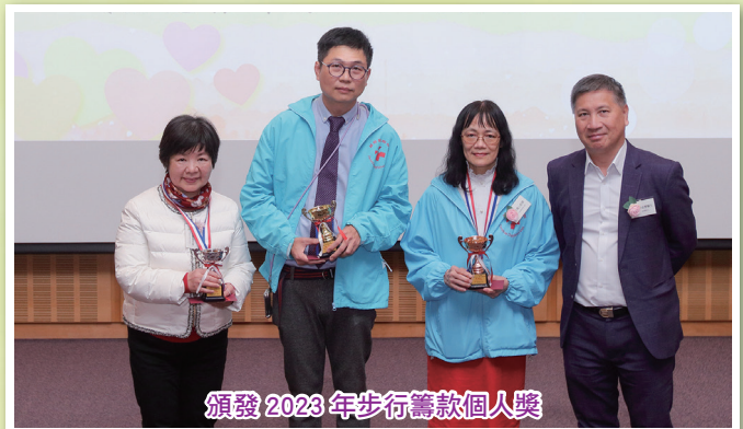
頒發 2023 年步行籌款個人獎