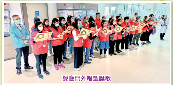
餐廳門外唱聖誕歌