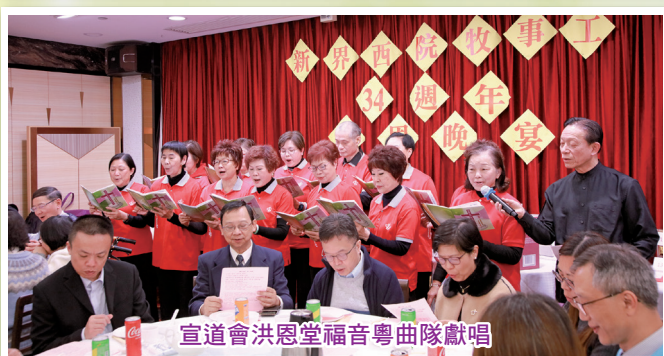
宣道會洪恩堂福音粵曲隊獻唱