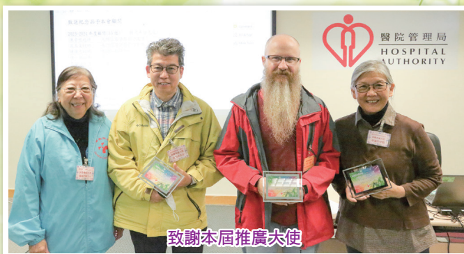
致謝本屆推廣大使