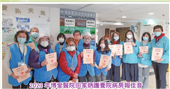
2023年博愛醫院田家炳護養院病房報佳音