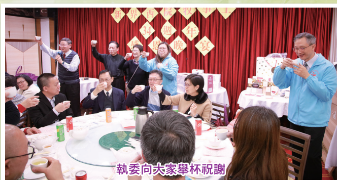
執委向大家舉杯祝謝