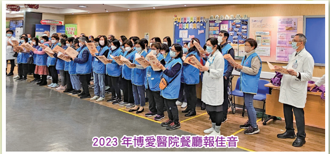
2023年博愛醫院餐廳報佳音