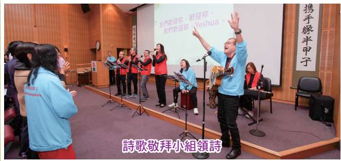
詩歌敬拜小組領詩