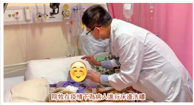
院牧在疫情下為病人進行床邊洗禮