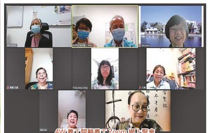
4W 義工關顧義工 Zoom 網上聚會