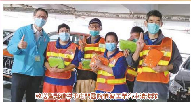
致送聖誕禮物予屯門醫院懷智工業汽車清潔隊