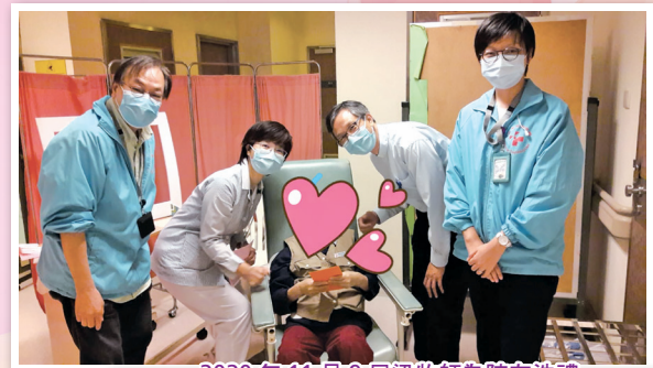
2020年11月9日梁牧師為院友洗禮

1. 感謝上主，疫情肆虐下，因應院友的特殊情況，在防方批准下，院牧部仍可以為病房中病友洗禮，上主豐盛恩典與祝福，是無遠弗屆，更跨越了環境及疫情的限制。