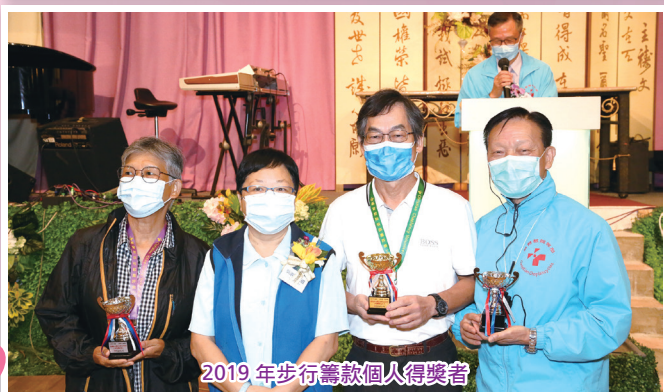
2019年步行籌款個人得獎者