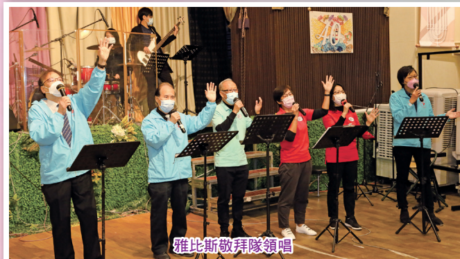
雅比斯敬拜隊領唱