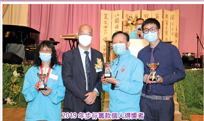
2019年步行籌款個人得獎者