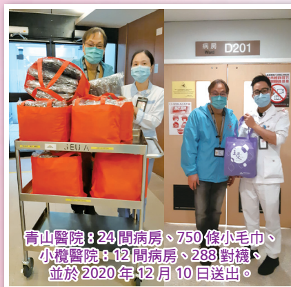
青山醫院：24間病房、750條小毛巾、 小欖醫院：12間病房、288對襪、 並於2020年12月10日送出。

2. 聖誕節是普天同慶的日子，院牧部送贈聖誕小禮物予青山/小欖院友、醫護，員工、更送上從上而來的祝福，讓佳節中增添歡欣氣氛。