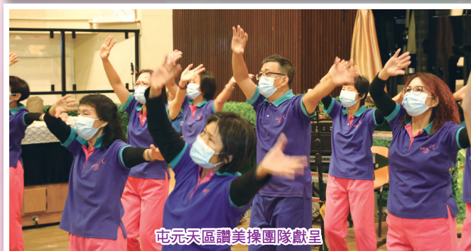
屯元天區讚美操團隊獻呈