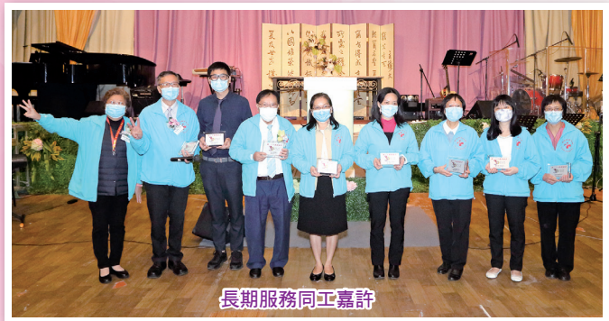
長期服務同工嘉許