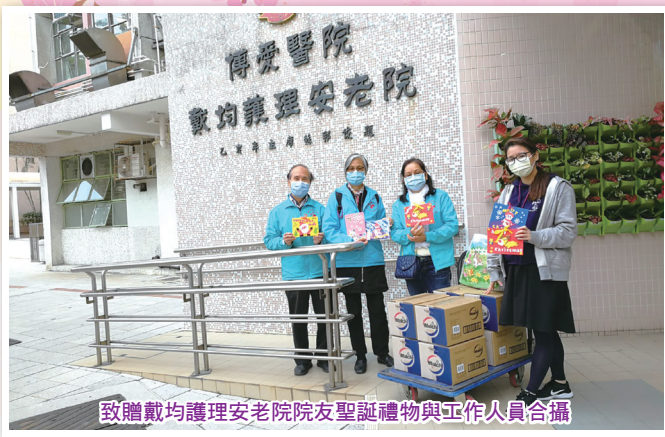
致贈戴均護理安老院院友聖誕禮物與工作人員合攝

5. 2020年12月19日下午，本部再度與錦光元朗綜合社區服務中心合作，向元朗小商新村村民派發聖誕祝福禮物包140份（禮物大部份蒙香港華人基督教聯會全港聖誕分區佈道活動送贈）。另外，還有得意毛公仔由佐敦浸信會社會服務中心送贈。