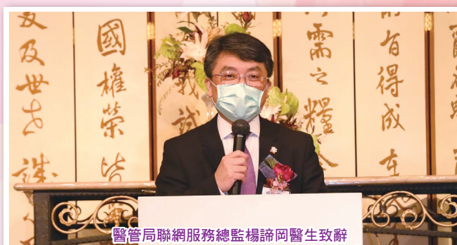
醫管局聯網服務總監楊諦岡醫生致辭

11 月 28 日在疫情放緩及限聚令容許下，於神召會元朗福音中心舉行「新界西院牧事工 30 周年感恩崇拜暨臨床牧關教育 / 義工訓練課程證書頒發及義工嘉許典禮」，邀得醫管局聯網服務總監楊諦岡醫生作主禮嘉賓，亦有病人家屬、康復者及主內同事分享見證，約有 250 人出席。