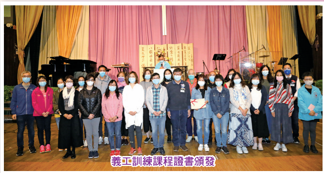
義工訓練課程證書頒發