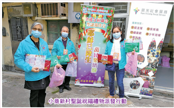
小商新村聖誕祝福禮物派發行動

5. 2020年12月19日下午，本部再度與錦光元朗綜合社區服務中心合作，向元朗小商新村村民派發聖誕祝福禮物包140份（禮物大部份蒙香港華人基督教聯會全港聖誕分區佈道活動送贈）。另外，還有得意毛公仔由佐敦浸信會社會服務中心送贈。