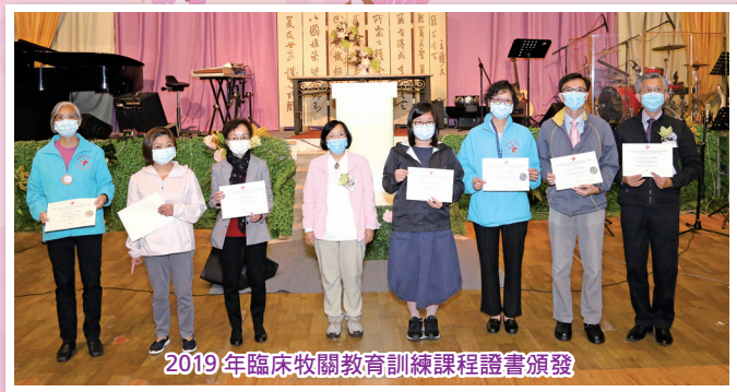
2019年臨床牧關教育訓練課程證書頒發