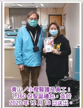
青山/小欖醫護及員工： 1,360份聖誕禮物包，並於 2020年12月18日送出。