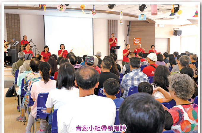
青葱小組帶領唱詩