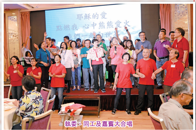
執委、同工及嘉賓大合唱