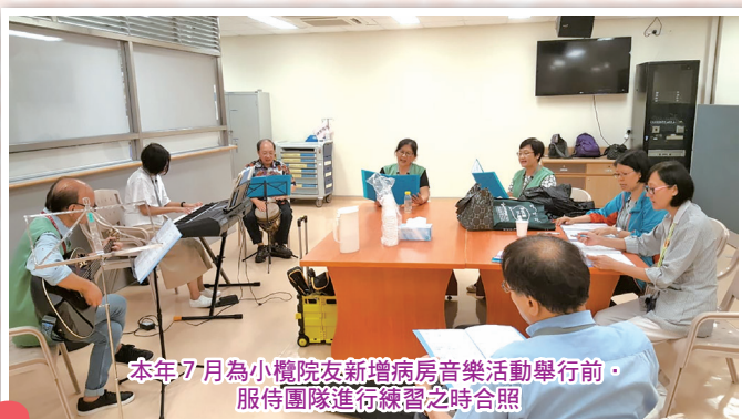
本年7月為小欖院友新增病房音樂活動舉行前·服侍團隊進行練習之時合照