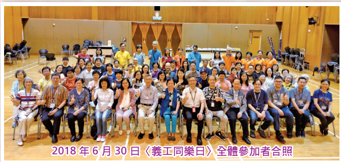
2018年6月30日〈義工同樂日〉全體參加者合照