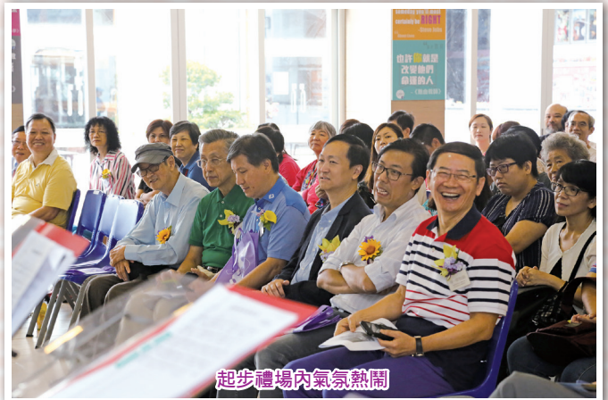
起步禮場內氣氛熱鬧