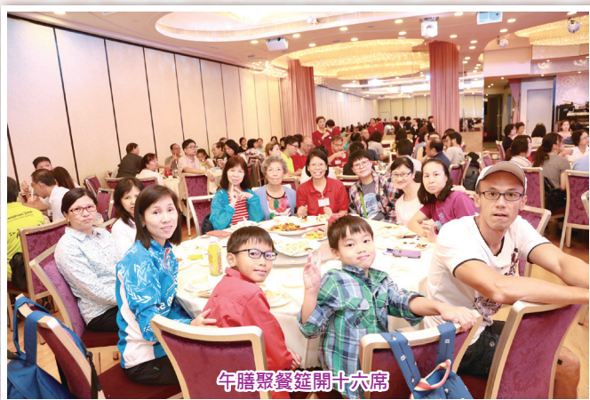
午膳聚餐筵開十六席