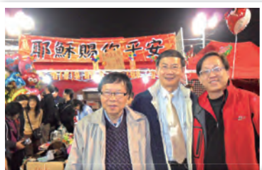
三位牧者攝於年宵攤位

本會在元朗區繼續與宣道會宣德堂舉行第三次年宵攤位活動，盼望透過有關攤位接觸區內居民。當中有分派福音揮春及義賣活動。