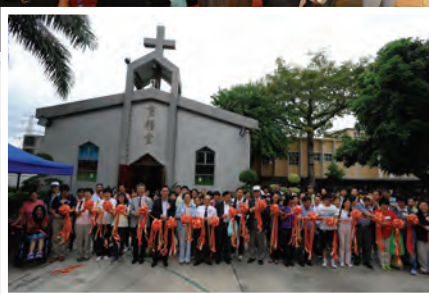
起步禮後嘉賓參與剪綵情況