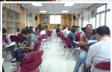
〈離院跟進探訪透視〉訓練第三講

2. 2011年11月26日（星期六）下午，開始為新生精神康復會田景宿舍舍友帶領小組活動。以後原則上訂於每月的第四個星期六下午舉行小組活動一次，每次活動約一小時。是項小組活動由離院跟進綜合服務院牧同工和青山醫院院牧室同工合作，並有區內教會及本會的新義工參與。有關活動以基督教信仰作媒介，為該宿舍舍友提供靈性牧養關顧。