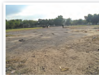
將座落於天壇街的天水圍醫院地盤