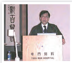
於8月20日在屯門醫院日間醫療中心演講廳舉行半天醫院探訪訓練課程

屯門醫院除平日開放給義工探訪外，亦於每月有一個周六或主日開放給牧者帶領信徒到醫院參與探訪，而參與探訪牧者及信徒必須參與「半天醫院探訪訓練課程」。