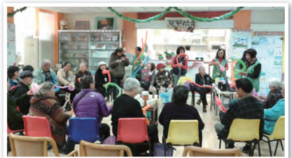
樂齡小組聚會情況