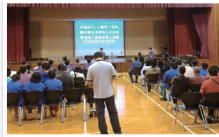
青山醫院基督教崇拜