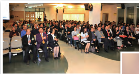
弟兄姊妹、來賓出席感恩會

是次感恩聚會於11月27日下午三時假宣道會屯門堂舉行。聚會主題為《以感恩為祭》，講員為洪水橋靈糧堂吳慧牧師。