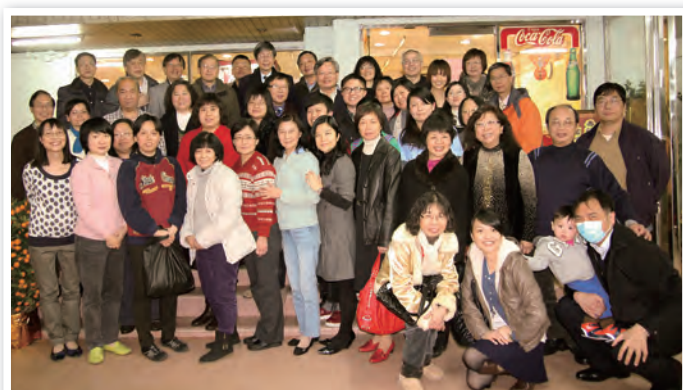
晚宴後一起拍照留念