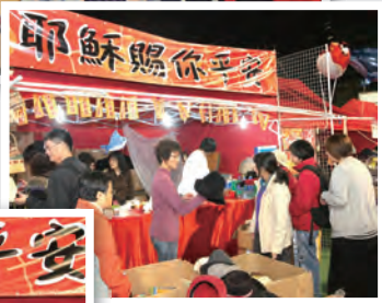
年宵攤位展銷情況