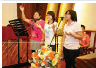
新界神召會敬拜小組負責詩歌敬拜時間

於2011年10月1日國慶日假期舉行，步行路線為馬鞍山海濱長廊至烏溪沙青年新村。起步禮在洪水橋靈糧堂舉行，起步禮結束後，隨即有旅遊巴士接載步行者到達步行起點。步行完畢後，已報名入營者一起在營內用膳及享用營內設施至黃昏時離營。是次步行籌款合共籌得款項$544,737。