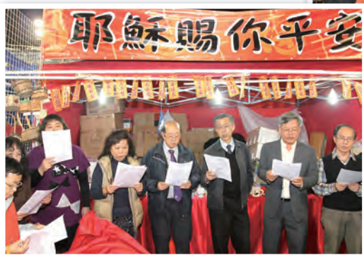
年宵攤位每晚均有簡短敬拜時間