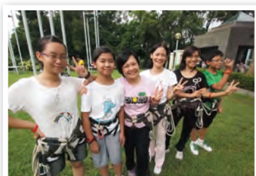
參與步行者享用村內康樂設施