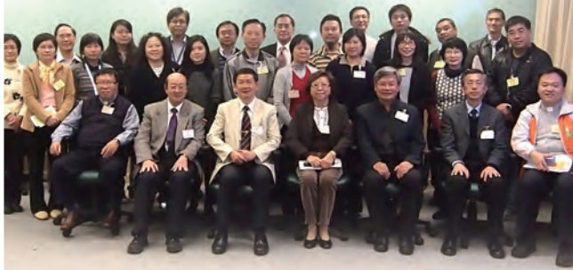
出席會員大會者一起拍照留念