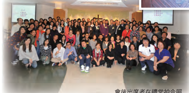
會後出席者在禮堂拍合照