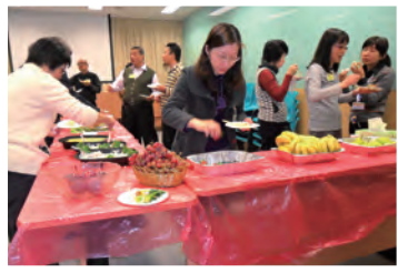
會前執委、顧問、教會代表及同工一起共享晚膳及交通

已於12月16日晚上假屯門醫院舉行，並順利選出新一屆執委。願主祝福他們在本會的事奉及與同工們有美好的配搭。