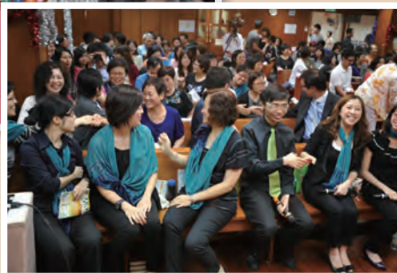
青山浸信會詩班青頌之泉獻唱