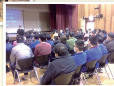
青山醫院院友聚會情況