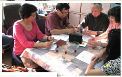
黃牧師代表中華傳道會佳音堂為天水圍戴均護老院長者洗禮和施聖餐