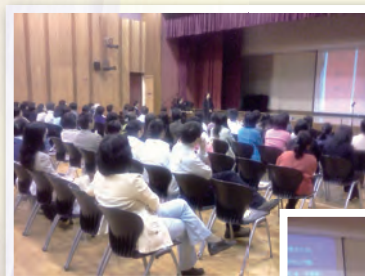
青山醫院員工聚會情況