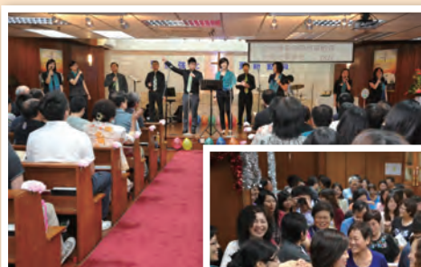
參加者出席心靈音樂會之情況

感謝神，本會首次舉辦「醫院院舍員工心靈音樂會」，已於今年21/5假借青山浸信會舉行，約有160位參加者出席。收回問卷的反應亦相當積極。多謝青山浸信會免費借出場地，及該會詩班「青頌之泉」為該晚音樂會獻唱。多謝「真証傳播」負責現場錄影，以及香港復康諮詢協會協辦，並贊助音樂會部份費用支出。