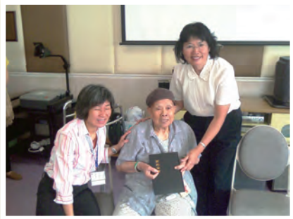
宣道會錦繡堂謝牧師為元朗賽馬會護老院長者洗禮後致送教會禮物