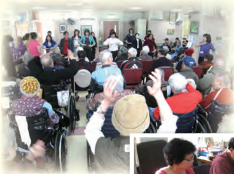
教會在護老院福音聚會帶領長者運動和遊戲