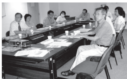
於25/9在屯門醫院舉行「院牧與教牧跟進離院病人研討會」情況

奉，顧問悉心的提點和董事(執委)們的支持！願神親自記念你們手所作的工。如神感動你對本會事工有所回應，請將《教會支持回應表》或《個人支持回應表》填妥，傳真至2468 5911或郵寄回屯門青麟路屯門醫院二樓F2032室屯門醫院基督教院牧部收。