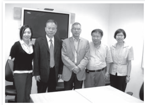
香港醫院院牧事工聯會同工與本會同工 拜訪博愛醫院行政總監李振垣醫生