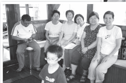
青山醫院基督徒團契舉行戶外活動情況