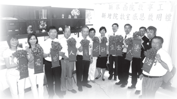
新增院牧室感恩啟用禮剪綵儀式

本 會經常與院方保持緊密合作及良好關係，如拜訪院方高層、定期出席有關彼此合作會議，例如：每週三屯門醫院寧養會議及青山醫院病人資源中心義工協調會議及博愛醫院社區健康中心義工協調會議。邀請院方高層出席本會活動/ 聚會及擔任嘉賓。今年六月屯門醫院院方更為本會提供多一個辦公室，可見院方對本會所提供之服務日漸重視及認同。