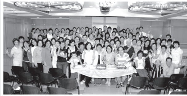
新界西院牧事工義工大團契在基督教恒道堂舉行08年度第二次聚會情況

義 工也是我們關顧的對象，他們在工作之餘，仍會付出愛心到醫院探訪和協助院牧舉行醫院福音聚會等。在義工關顧方面，我們會透過團契和不同形式聚會讓組員有機會彼此牧養和分享。此外，我們亦會安排一些特別聚會，讓義工有機會在事奉和意見上交流和分享心得。三院義工一起加入新界西院牧事工義工大團契正是我們未來要朝向的方向，盼望藉此團契可加增三院義工合作和認識機會。