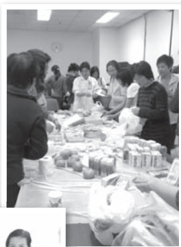
屯門醫院基督徒團契舉行聚會情況

醫 護人員經常要面對工作上的壓力，因此他們亦需要院牧同工的關心。院牧除了關心他們外，還會為有需要員工提供心靈關顧，此外院牧亦會定期出席他們的團契和不同的小組聚會給予鼓勵和支持。而醫護人員亦樂意在工作之餘，與院牧一起攜手推動醫院福音事工，因此院牧與醫院醫護人員的關係是非常緊密的。