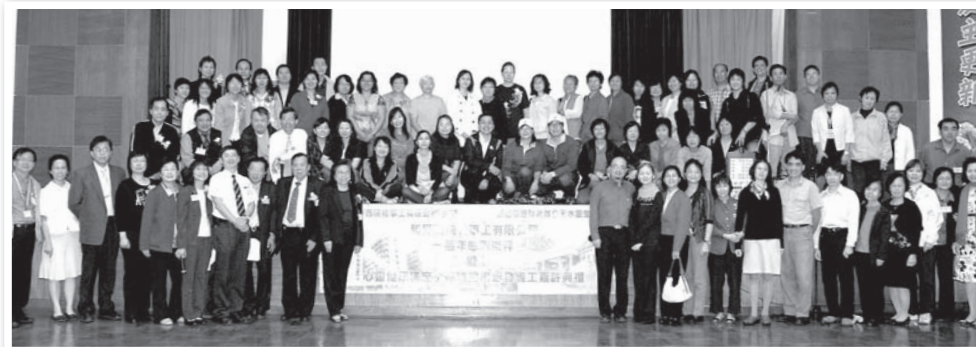
去年舉行一周年感恩聚會情況