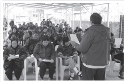
「上水溫馨院舍」舉行聚會情況