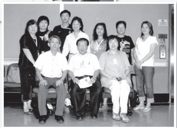
黃牧師與青山醫院受洗病人家屬及其教會牧者一起拍照留念