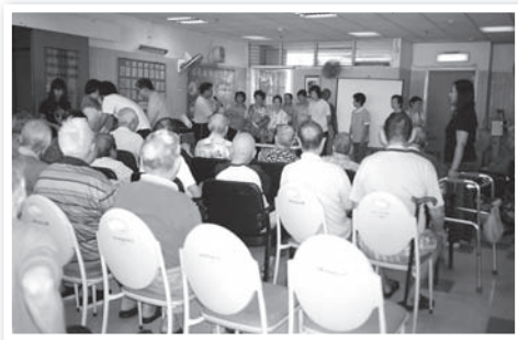
「博愛醫院賽馬會護理安老院」舉行聚會情況

對 於那些已決志離院病人，我們在徵得他們同意下會轉介他們到合適教會繼續關心及牧養，而對於那些已轉到院舍暫住的院友，我們會進行家訪或會定期為他們舉辦院舍聚會或活動。現時我們提供有關類似服務「上水溫馨院舍」、「博愛醫院賽馬會護理安老院」。有關那些已離院而行動不方便的病人，我們也盼望日後可以與教會合作，為他們提供家訪外展服務。