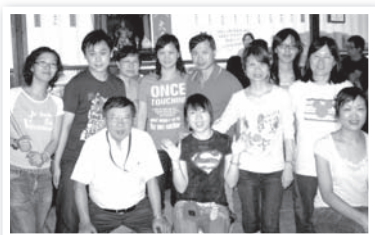
博愛醫院基督徒團契舉行戶外活動情況