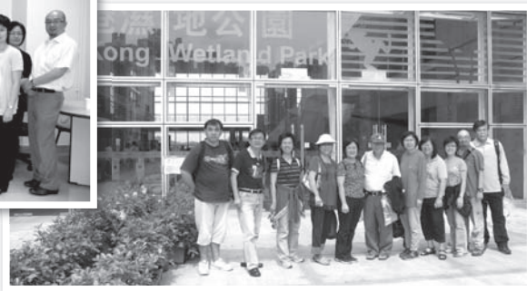
同工生活日攝於香港濕地公園