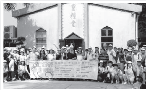
今年步行籌款起步禮情況

本 會每年會舉行一次籌款活動和周年感恩聚會，要籌備有關聚會/活需要動員大量人手及時間。感謝神！在歷屆的步行籌款及感恩聚會裡，我們都目睹神對我們的祝福及弟兄姊妹的支持。本年10月1日參加步行人數有180人，有82人參加步行籌款後在宣道園舉行之燒烤活動，截至10月31日為止共籌得款項約為$371,984.50，而在07年11月18日一周年感恩聚會，約有150人出